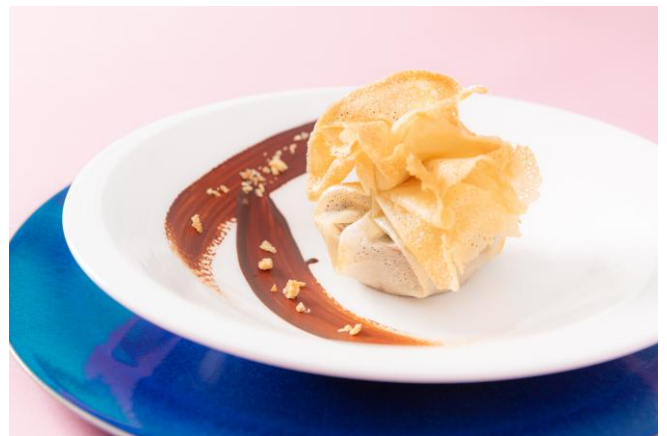
ウェルカムプレート「チョコレートタルトのパートブリック包み焼き」

ドリンクはフリードリンクにて、コーヒー、紅茶、ハーブティーなど、ソフトドリンク7種をご用意しております。