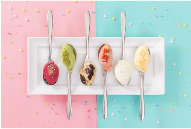
アイス食べ放題！ ※イメージ 実際の提供方法とは異なります。