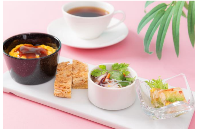
「カレー風味のオムライス」、「タコと春雨のマリネ」などセイボリーも充実