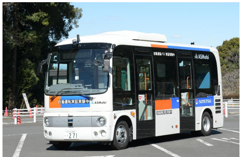
自動運転の実証実験に使用する小型バス