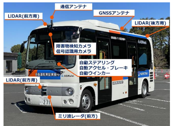
使用する小型バスの主な装備

②「実際の運行に耐えられる、あるべき遠隔システム」を実証するため、次のシステムを使用します。