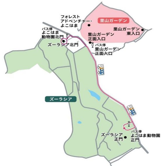
実証実験の運行路線図