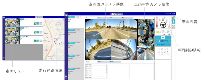
東海理化の遠隔監視システム