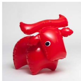
5. リブシェ・ニクロヴァー、ファトラ社《膨らむおもちゃ「水牛のホウコラ」》1985年