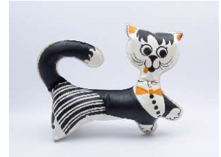
3. リブシェ・ニクロヴァー、ファトラ社《膨らむおもちゃ「ネコのブラックキー」》1969年