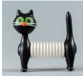
2. リブシェ・ニクロヴァー、ファトラ社《ネコのアコーディオン》1963年