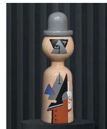
9. テレザ・タリホヴァー〈tititi〉《木製指人形「エミール・フィラ」》2024年