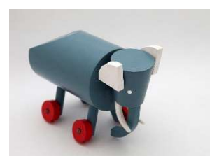
6. ラジスラフ・ストナル《ゾウ(国立家内工業教育研究所のためのデザイン)》1930年頃