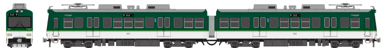
600形（新塗色イメージ）