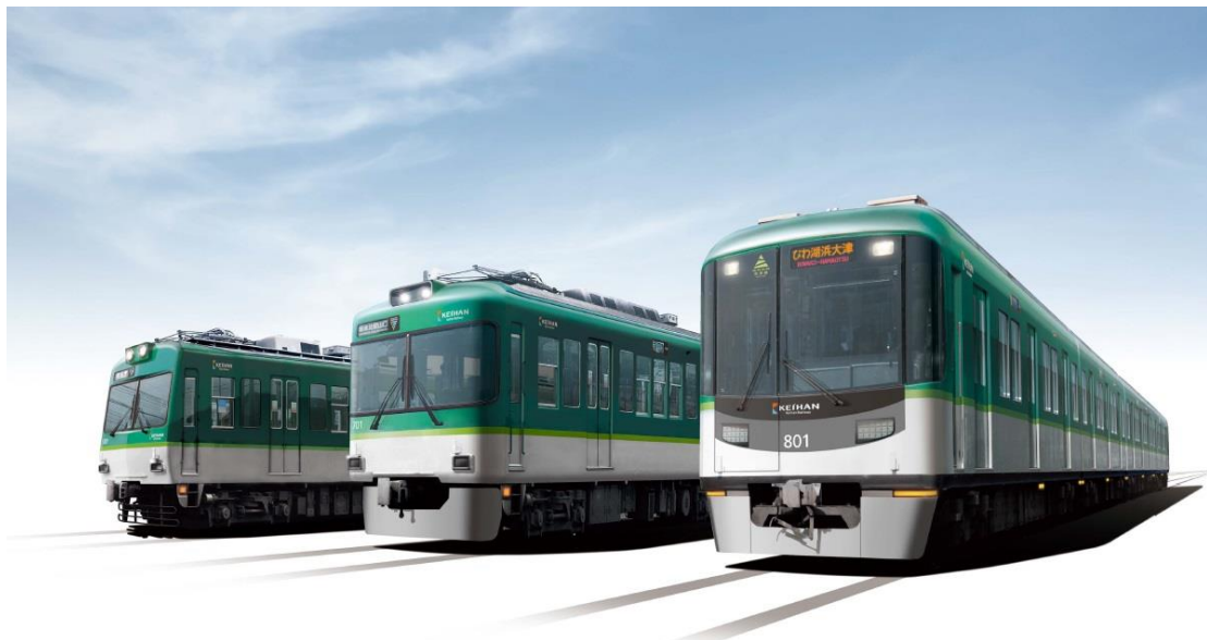
カラーデザイン変更後の大津線車両イメージ （左から600形、700形、800系）