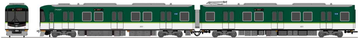
800系（新塗色イメージ）