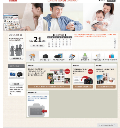
ログイン後トップ画面

CANON iMAGE GATEWAY に登録されているユーザー情報に合わせ、カード形式でリンクボタンを表示する新たなインターフェースを導入します。登録製品や居住地域など、一人ひとりの製品使用環境に合わせた、ファームウェアアップデートなどの情報を入手することができます。