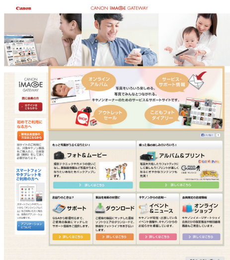
ログイン前トップ画面

キヤノンマーケティングジャパン株式会社(社長:川崎正己)は、オンラインアルバムを中心とした写真関連サービスや、メールによる新製品情報、サポート情報の提供などを行う会員制ウェブサイト“CANON iMAGE GATEWAY”を本日10月24日にリニューアルします。