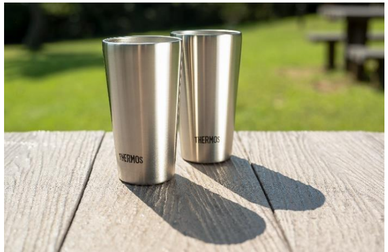
サーモス真空断熱タンブラー ペアセット