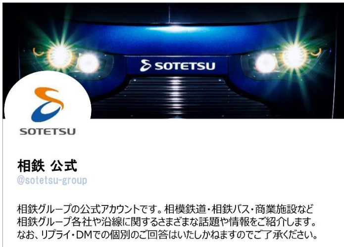
相鉄グループ公式 Twitter(イメージ)