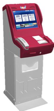
マルチメディア端末「MINISTOP Loppi」 (ミニストップ店舗内に設置)