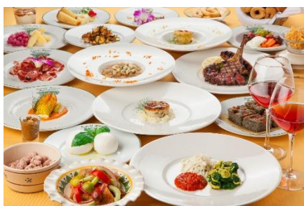
アンティキ・サポーリ