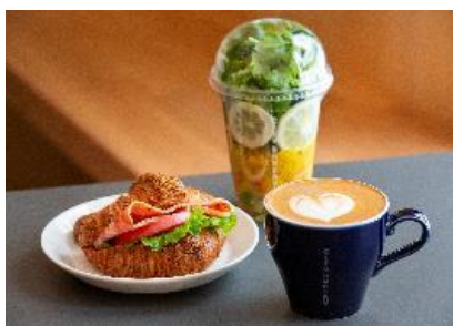
ザ シティ ベーカーリー