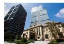
東京ガーデンテラス紀尾井町