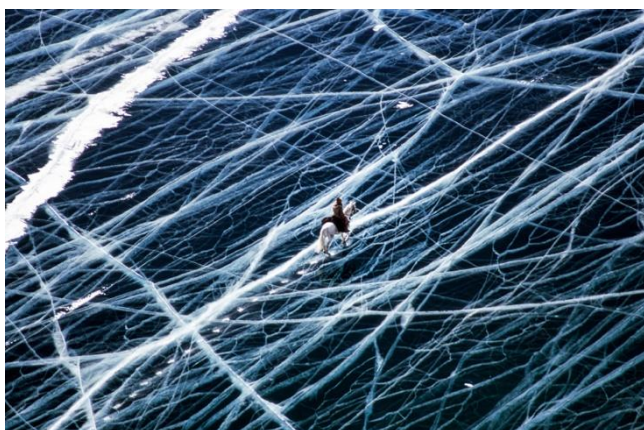
神秘の湖 バイカル湖 (ロシア) マシュー・ベイリー