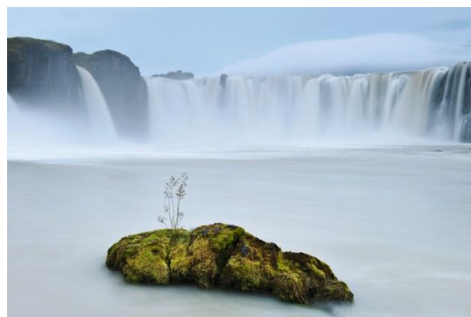
神々の島 ゴーザフォスの滝 (アイスランド) オルショヤ・ハールベリ