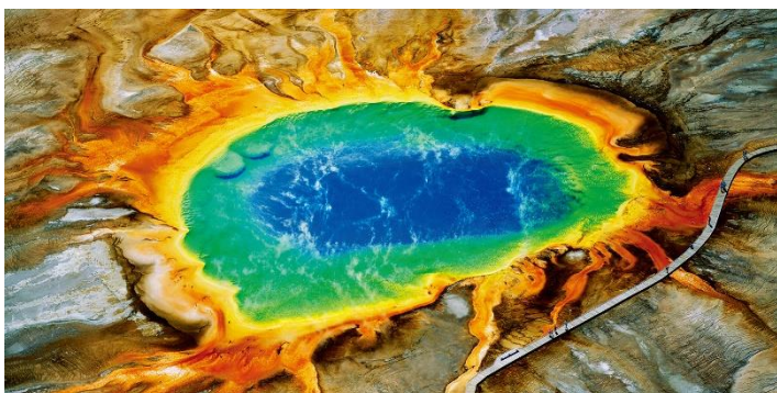
イエローストーン国立公園 (米国ワイオミング州) ジョージ・スタインメッツ