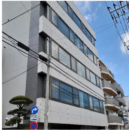
都立大学駅前ビル (都立大学前駅から徒歩2分)