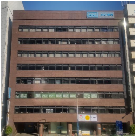
富士火災横浜ビル (新横浜駅から徒歩3分)