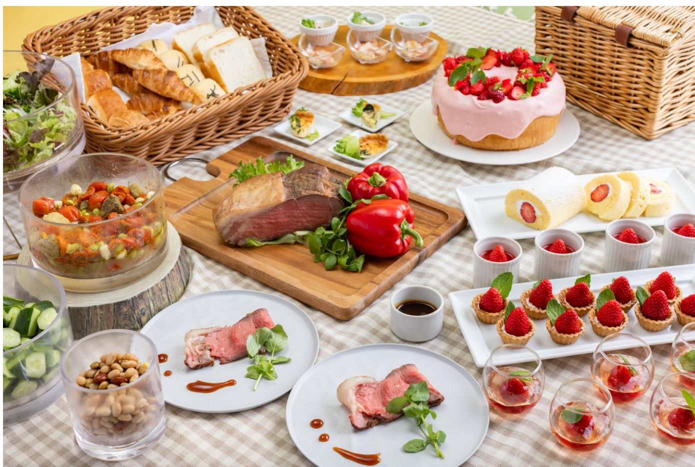
GWビュッフェ イメージ(ローストビーフはディナーのみの提供)

ライブキッチンではランチ「チーズリゾット」、ディナー「ローストビーフ」をご提供 約50種類のメニューで特別なひとときを