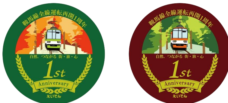
ヘッドマークデザイン

※運転時間は日によって異なります。また、車両点検やその他の理由により運休や運行期間終了日を変更することがありますのであらかじめご了承ください。