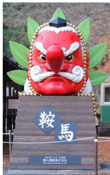
衣装の取り外し後

※記載以外にも「鞍馬線全線運転再開1周年記念行事」を計画中ですので、決まり次第、随時ご案内させていただきます。