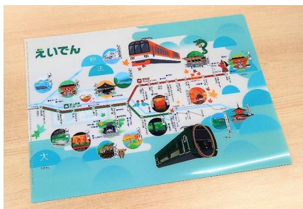
えいでんイラスト路線図オリジナルクリアファイル

オープニングイベント終了後、鞍馬駅駅前広場にて先着200名様にプレゼントします。