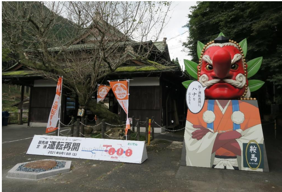
運転再開時の鞍馬駅の様子

新型コロナウイルスの感染状況により、内容を変更する場合がございます。その際は、随時、叡山電車公式ホームページおよび叡山電車公式Twitterにてご案内いたします。