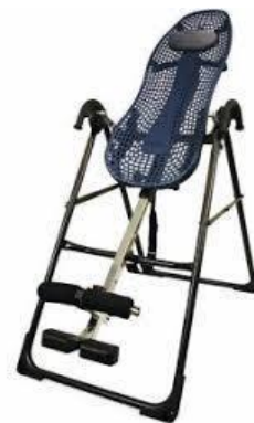
Teeter Hang Up