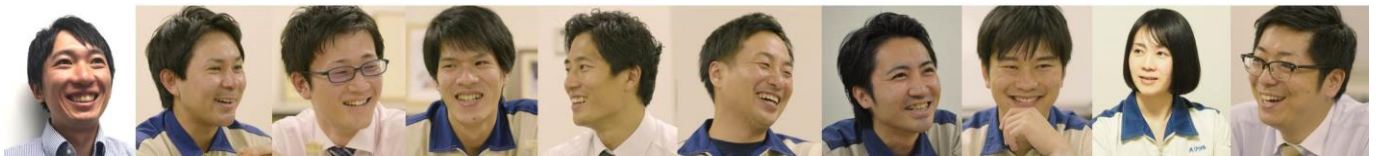
△「別鶴」プロジェクトメンバー