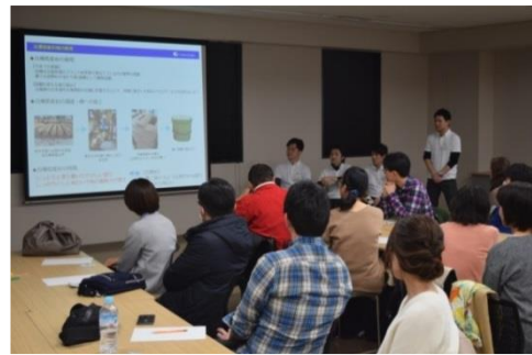
△セミナーイメージ