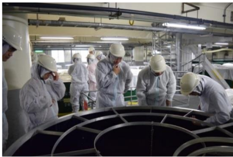
△酒蔵見学イメージ

「別鶴」プロジェクトは、「若い世代に、もっと日本酒を楽しんで欲しい」という思いを持つ白鶴若手社員が運営するプロジェクトです。日本酒に興味はあるが、難しそう、たくさん種類があって分からないなどと感じている方に、日本酒の基本知識や、実際の造り方、料理との楽しみ方などを体験しながら学んでいただける「酒蔵見学&セミナー」を企画しました。セミナー終了後、様々なタイプの日本酒と軽食のペアリングを楽しみながら、お気に入りの日本酒を見つけていただきたいと思います。