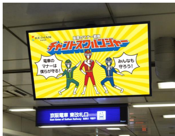
旅客案内ディスプレイ掲出イメージ