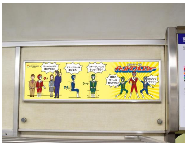
車内掲出イメージ

4. テーマ・掲出時期 第1弾のテーマ:座席のマナー 4月～7月掲出 第2弾のテーマ:音のマナー 8月～11月掲出 第3弾のテーマ:気配りのマナー 12月～3月掲出