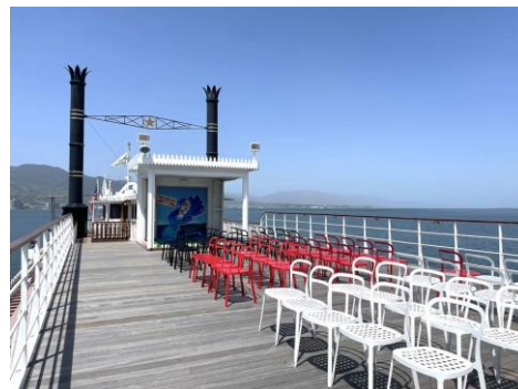
スカイデッキ(当日の座席レイアウトは異なります)