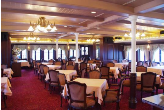
レストラン一例(会場・座席指定不可)