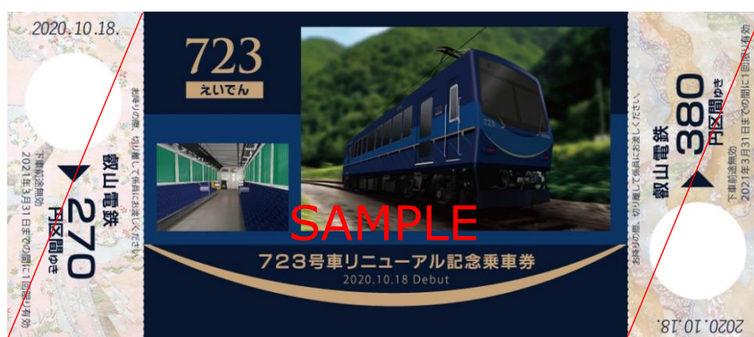
「723号車リニューアル記念乗車券」のイメージ (イラストの部分は写真となる予定です。)