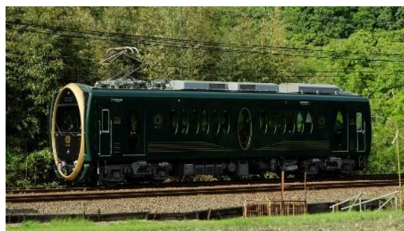
732号車 観光列車「ひえい」