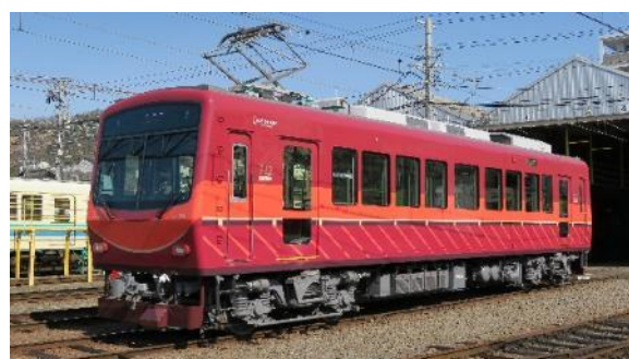
2019年にリニューアルした722号車