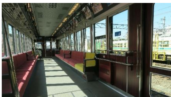
リニューアルした722号車の内装