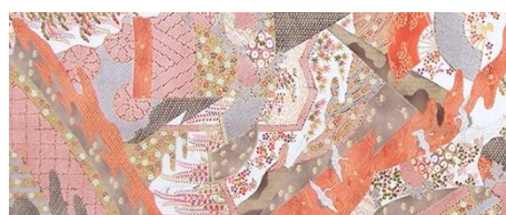
京友禅のデザインイメージ