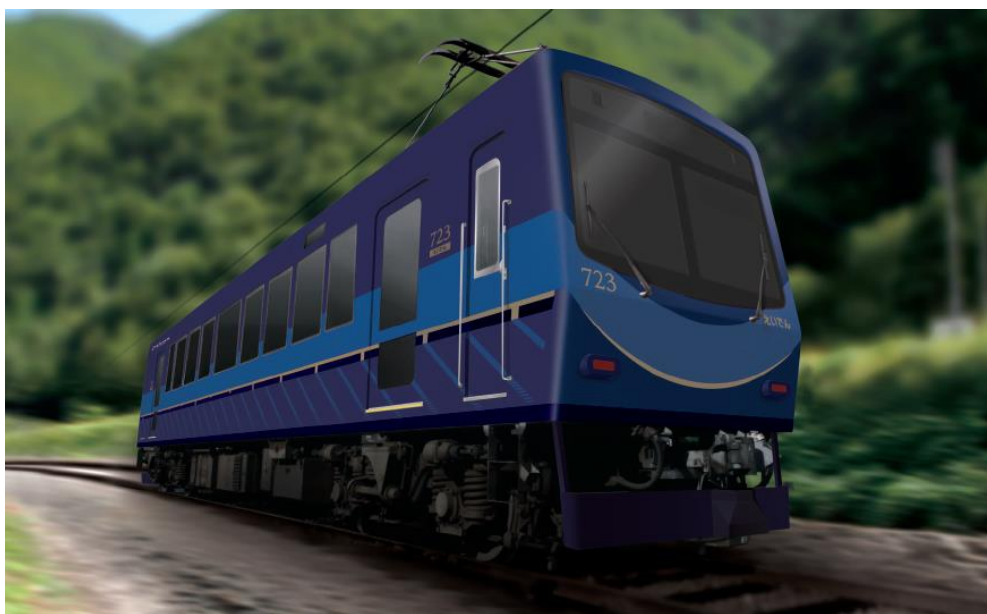
723号車リニューアルのイメージ