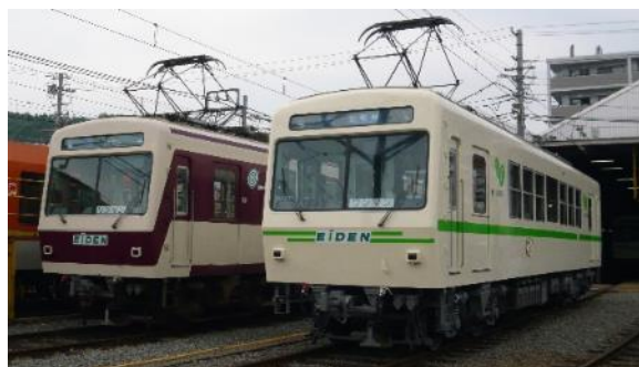
運用開始当時の塗装（左）とデザイン変更後の塗装（右）

運用開始から30年以上が経過したため、732号車は2018年に観光列車「ひえい」へ、722号車は2019年に沿線の神社仏閣をイメージした「朱色」のカラーリングへリニューアルを行いました。