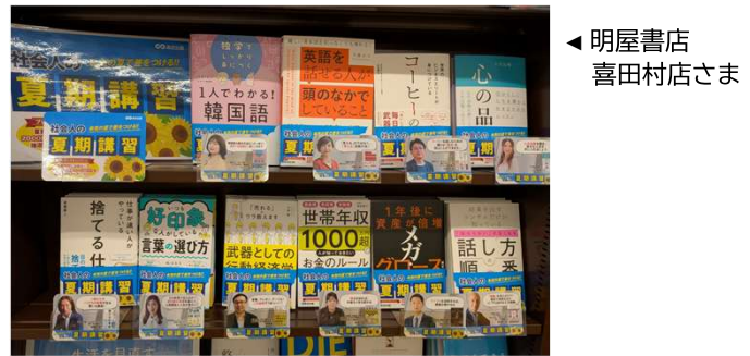
◀ 明屋書店 喜田村店さま

今年もすでに複数の店舗で展開を開始！夏前～秋ごろまで長期でご展開いただいています