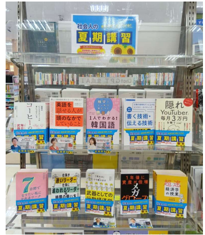
◀ 紀伊國屋書店 久留米店さま ACADEMIA 菖蒲店さま ▶

また、点数・冊数やテーマ設定も柔軟に調整できることから、「語学特化」「秋期講習」など売り場や季節に合わせたアレンジも可能です。