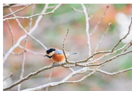
ケーブル延暦寺駅で撮影「ヤマガラ」