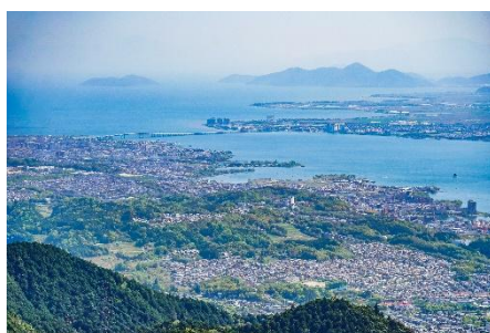
「山のデッキ」からの眺望(北側)