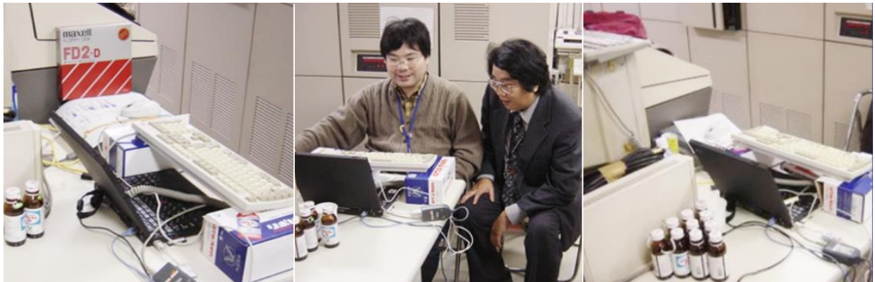
はやぶさ管制室内のブログ執筆スペース

アップされた写真付きのブログには、飲み干された「リポビタンD」の空きビンと執筆用のキーボードを支える「リポビタンD」の10本箱がつつましく映し出されていました。タッチダウンの様子を伝えるとともにこの執筆スペースの様子も、ありのままに世界に発信されたのです。