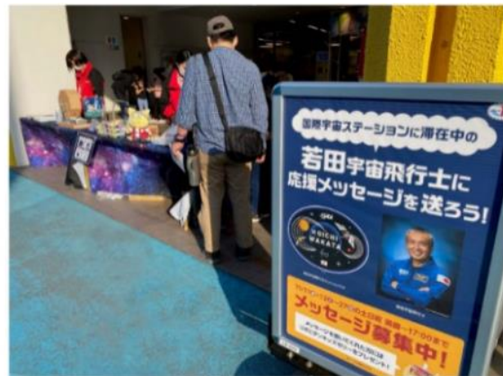
よみうりランド「大正製薬 SPACE FACTORY」にて、若田宇宙飛行士メッセージお届けイベント

そのとき開発中の新製品の中に「リポビタン JELLY」(清涼飲料水)があることを思いつきました。形状は、パウチタイプのゼリー飲料、1袋でおにぎり1個分のカロリーや1日分のビタミンB1・B2・B6(栄養素等標準基準値)を摂取できる「これだ!!」と感じました。すぐさまそのコンセプトをJAXAにお伝えしたところ「パウチ容器なら仕事の合間でも気軽に食べられる」「キャップ付きは良い」「エネルギーチャージできるのはうれしいね」との声をいただいたのです。