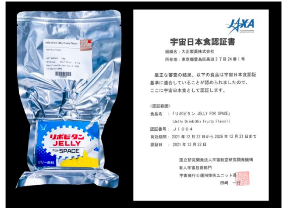
左：リポビタン JELLY FOR SPACE 外装

その後、2022年の若田ミッション、2023年の古川ミッション、そして、いよいよ2025年3月以降の大西ミッションで国際宇宙ステーションに搭載品に選ばれました。