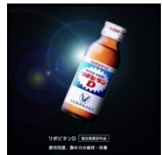
リポビタンD <指定医薬部外品> 疲労回復

ショックをぬぐい切れない状況の中、ふとした疑問が頭をよぎります。私たちが実現したいことは「リポビタンDを宇宙に持っていくこと」なのか…、いやっ、そうではない。私たちが実現したいことは「少しでも宇宙飛行士の支えになりたい」、「頑張る宇宙飛行士を応援したい」ということだ。私たちは、今一度、この原点に立ち返って考えました。