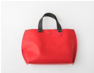
<PANU BAG (パヌ バッグ) > 1st (3階) バッグ 25,920円(税込)