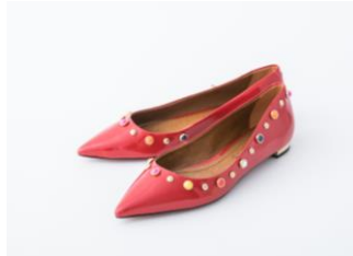
<CARRANO (カラーノ) > 2nd (4階) パンプス 21,600円(税込)