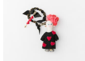
<DEMODEE (デモデ) > 1st (3階) ドールチャーム「AMORE」 10,800円(税込)