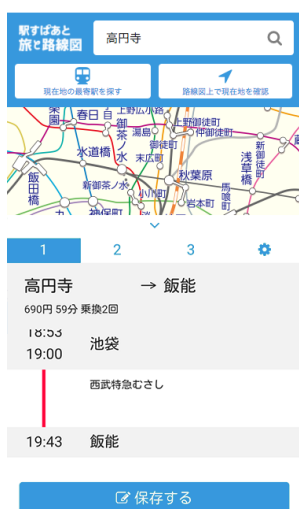
経路検索結果画面