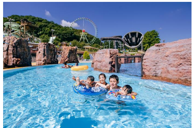
「東京サマーランド」グレートジャーニー （流れるプール）（イメージ）