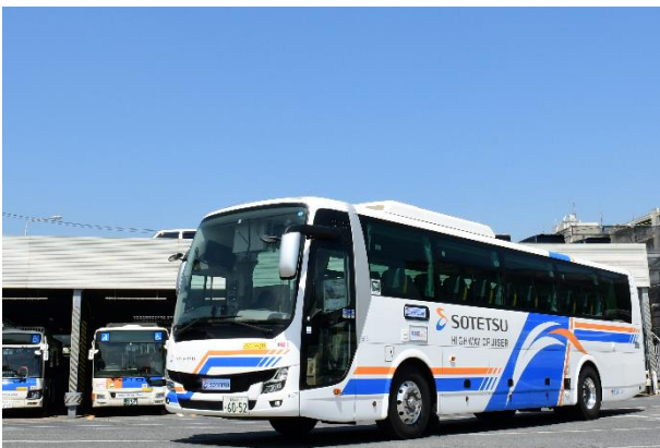
運行する高速乗合バス（イメージ）