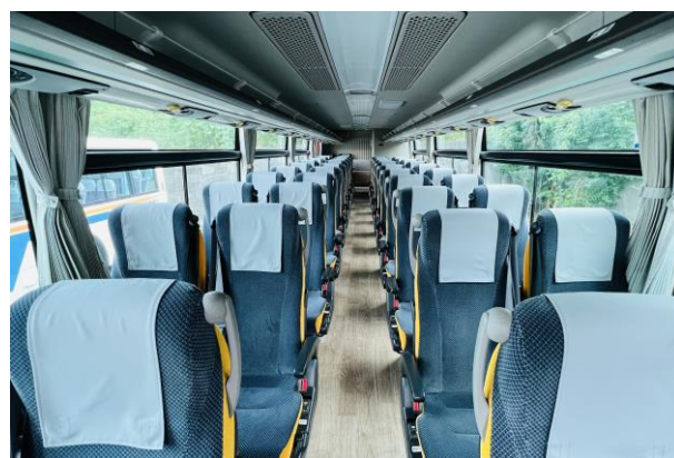
使用車両の座席（イメージ）