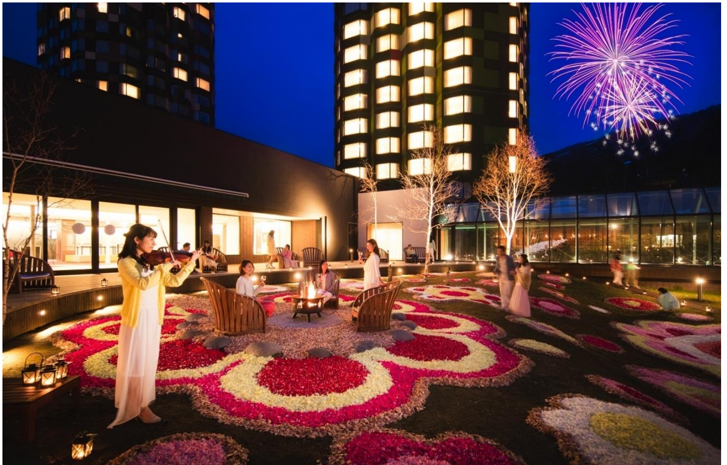
*2016年に撮影した画像です。

北海道最大級の滞在型リゾート「星野リゾート トナム」は、2019年4月27日～5月10日までの期間、「花咲くトナム」を実施します。当イベントは、北海道でいち早くお花見を楽しんでほしいという想いのもと、2016年より開始しました。目玉は、ホテルの中庭一面に広がる花景色「花咲くウェルカムコート」です。今年は、その景色を夕暮れ時から夜にかけてライトアップし、花景色と花火の鑑賞を一度に楽しめるよう演出するのが今年の特徴です。また、春の訪れを感じながらさらにゆっくり滞在したい方向けに、花に囲まれた空間で朝食が食べられる1日2組限定の宿泊プラン「花咲くステイ」を販売します。