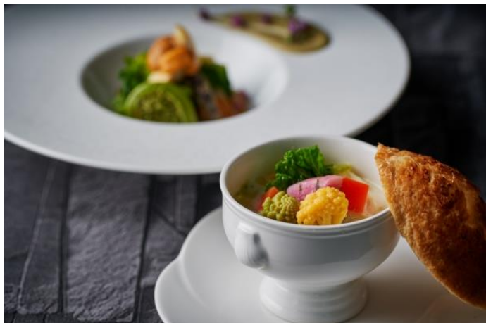
▲シェフ自慢の「パイ包みスープ」イメージ

【ご予約】 https://www.bestbridal.co.jp/restaurant/shikitei/