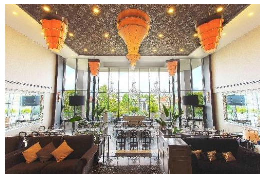
▲【写真左より時計回り】ガーデンテラス席、庭園側から臨む大宮璃宮外観、四季庭内観

大宮璃宮3階の「カフェ&レストラン 四季庭」は、美しい庭園の四季を眺めながら食べられる食事が自慢の、和モダンと欧風を融合したフレンチレストラン。「料理でも季節を感じていただきたい」との思いから、「彩食健美」をコンセプトに、見て楽しく、美と健康を意識したフランス料理やデザートをご提供しています。