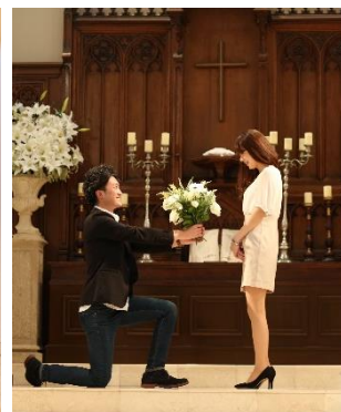
プロポーズイメージ