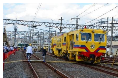
マルタイの乗車体験(写真右) レールサイクル乗車体験(写真左)