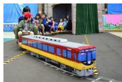
ミニ電車に乗ろう