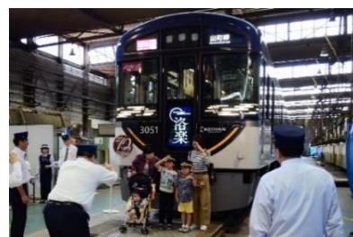
制帽・ヘルメットで「ハイ、チーズ！」