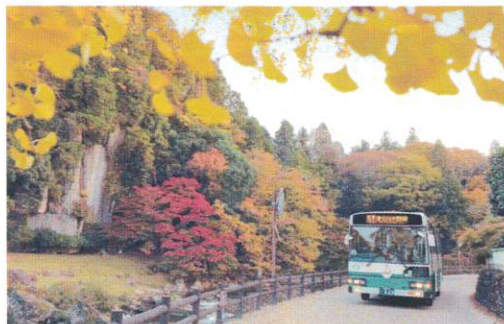
10月 大野寺弥勒磨崖仏と路線バス おののまがいのつ