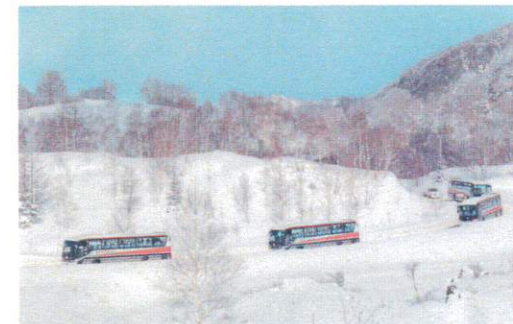
12月 志賀高原を梯団で走行する観光バス