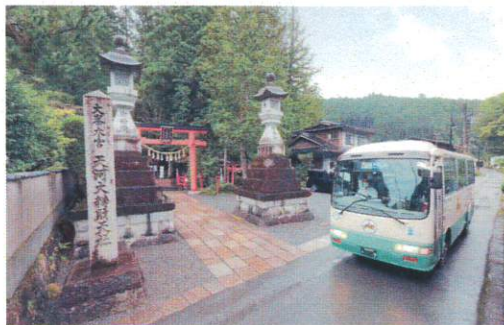
7月 天河大辨財天社前を走る路線バス てんかわだいべんざいてんしゃ