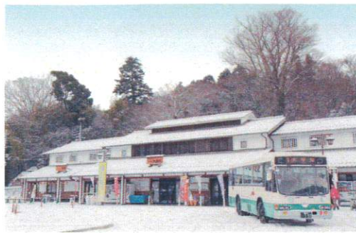
2月 道の駅「宇陀路大宇陀」に乗り入れる路線バス