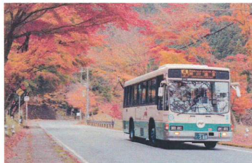
11月 観音峰登山口付近を走る路線バス