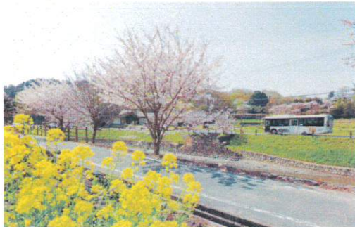
4月 甘樫丘付近を走る明日香周遊バス「赤かめバス」 あまかしのおか