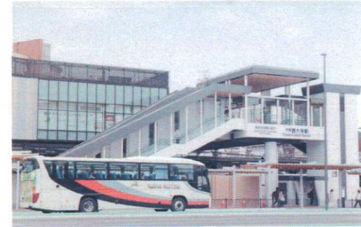
6月 大和西大寺駅南口に乗り入れるエアポートリムジンバス