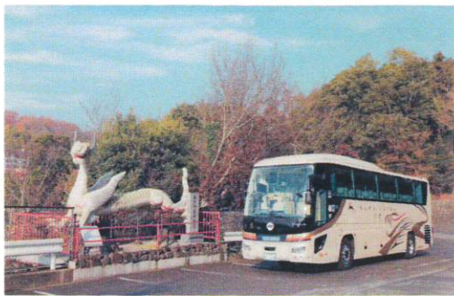
1月 信貴山 朝護孫子寺の「白虎」と貸切バス特別車両「白虎」 しきさん ちょうごそんしじ