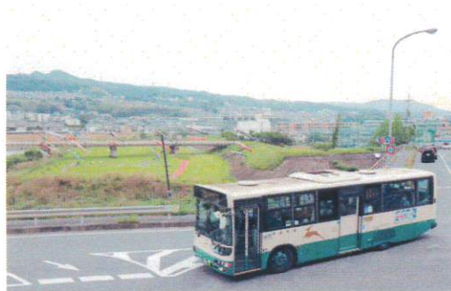
5月 鯉のぼりが舞う大和川沿いを走る路線バス