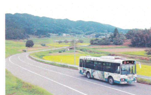
9月 柳生街道を走る路線バス やぎゅう