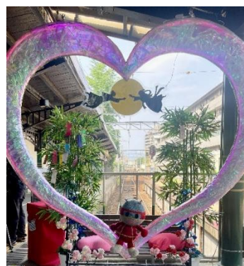
「LOVEなベンチ！」七夕装飾