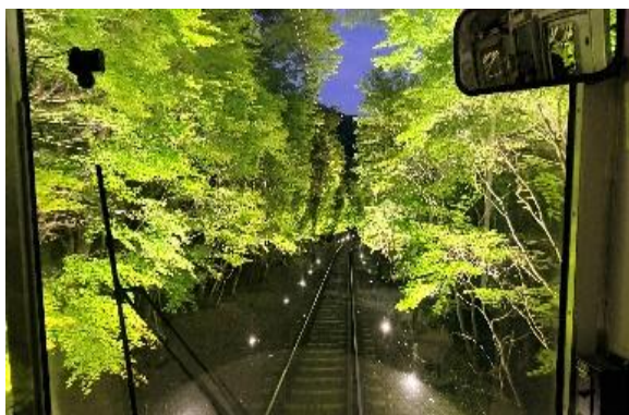
もみじのトンネル