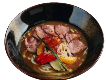
牛たんカレーうどん