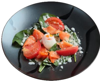
ほうれん草とスモークサーモンのうどん