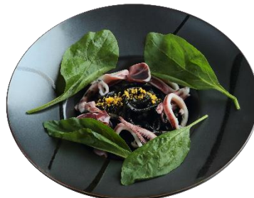
漆黒のイカスミうどん