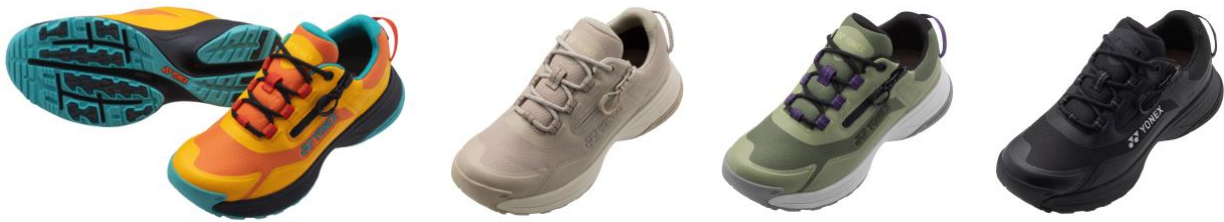
「パワークッション125」左からイエロー、ベージュ、カーキ、ブラック