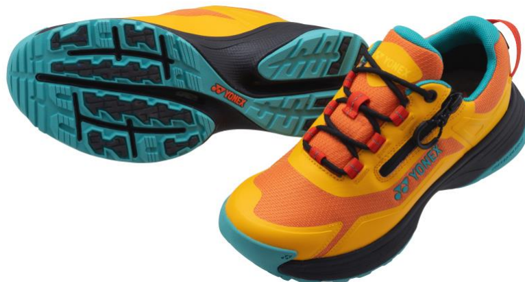
「パワークッション 125」(イエロー)

本製品のコンセプトは「いつでも・どこでも・心地よく」。お客様が求めるウォーキングシューズの多様化に対応し、街でも山でも歩きやすい高いクッション性と安定性に加え、防水機能を備えた軽量のオールウェザーシューズです。