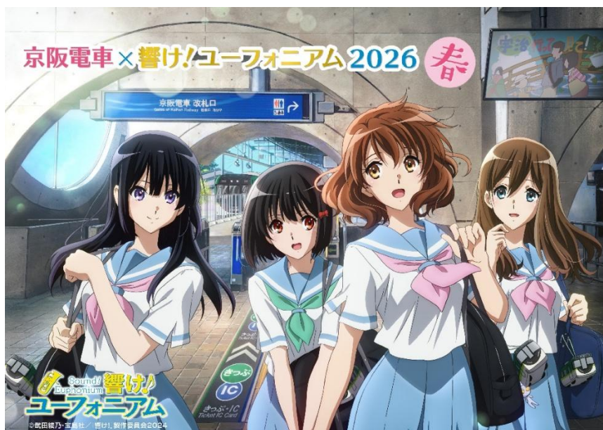
「京阪電車×響け！ユーフォニアム 2026 春」 メインビジュアル