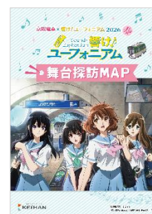
舞台探訪 MAP(イメージ)

【参加方法】特設サイト「京阪電車×響け！ユーフォニアム 2026」からご参加いただけます。