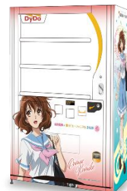
ラッピング自販機(イメージ)