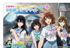
京阪線フリーチケット (イメージ)