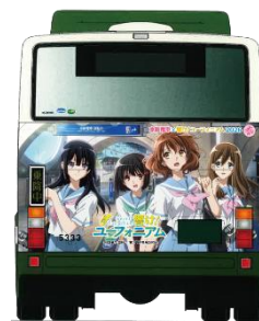
ラッピングバス・背面(イメージ)