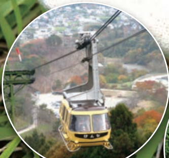
宝登山ロープウェイ