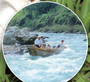
長瀬ラインくだり

ブルーベリーイベントに関するお問合せ ☎ 秩父鉄道 TEL.048-523-3313(平日9:00~17:00)