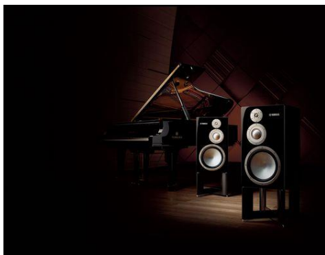
ヤマハ HiFi スピーカーのフラッグシップモデル 「NS-5000」