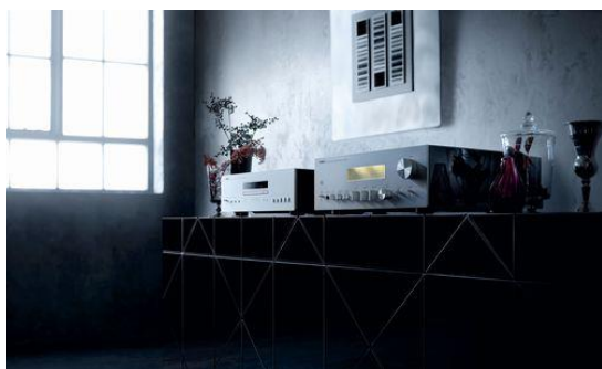
プリメインアンプ「A-S2100」 CD プレーヤー「CD-S2100」