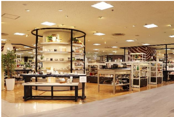
<クッキング&ダイニング>