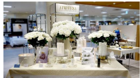
<アトリテナ>売り場

厳選された原産地からの自然の恵みを活かし、からだの内と外から美と健康を追求するアトリテナ。ダマスクローズの精油香る炭酸パック、キャビアエキス配合濃厚テクスチャーのフェイスクリーム、自然由来の複合酵素の力でからだを中からサポートする美容・健康ドリンク等、バラエティーに富んだラインアップで美しく豊かな生活をご提案します。