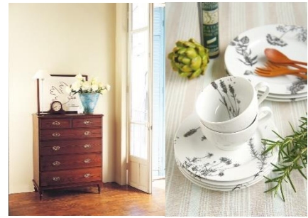
<私の部屋>イメージ画像

世界中から流行に左右されない上質なインテリアグッズを厳選し、日本の美しく豊かな四季の変化や歳時記に沿って現代の暮らしに合わせて提案します。