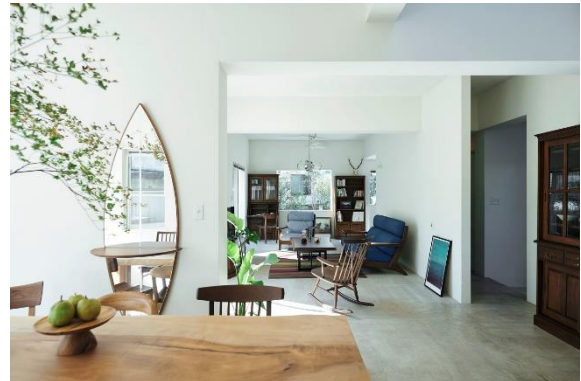
<葉山家具>イメージ画像

株式会社 東急百貨店(以下、当社)は、“日々を「豊かに暮らしたい」”をテーマに、たまプラーザ店4階ホームインテリアワールドをリニューアルしました。