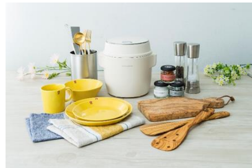
<キッチン&ダイニング>イメージ画像

さらに友人への簡単なお土産やちょっとした感謝の気持ちを贈るのにぴったりな「プチギフト」も集積。お客さまの日々のライフスタイルに合わせてお選びいただけます。