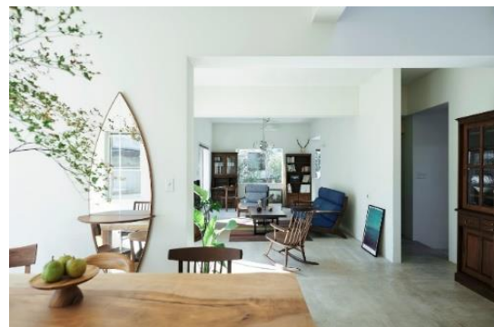
<葉山家具>イメージ画像

木のぬくもりあふれる天然木をぜいたくに使用したオリジナル家具を中心に、くつろぎが感じられるインテリアアイテムを取り揃えています。堅牢な作りのオリジナル家具は使い込むほどに艶と味わいを増し、長くご愛用いただけます。