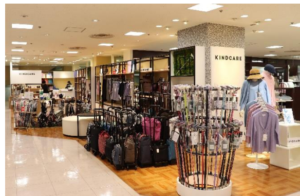
<カインドケア>売り場

アウター、歩行関連(ステッキ、横押しカート、シルバーカー、シューズ)を中心に介護用品に必要なアイテムを幅広く取りそろえています。特にシューズ、ステッキは今まで以上に豊富な種類を用意しました。ステッキは高級感と木のぬくもりを感じさせてくれる「箱根寄木細工」や「印伝」、木製のベーシックと上質感を味わえる「黒檀」や「紫檀」、ドイツ製の「ガストロック」、人気の北欧柄「Finlayson(フィンレイソン)」伸縮ステッキなど、定番から珍しいステッキまで豊富に取りそろえています。