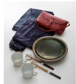
<コレパン〜日本の暮らし雑貨店〜>イメージ画像

私たちの暮らしを支えている日本の伝統と職人の技術を、“五感”で感じることができる暮らしの器や生活の品を紹介しています。用の美を原点とする益子焼をはじめ、伝統的な柄を取り入れた久留米織の割烹着やもんぺ、瀬戸内で作られる着心地の良い衣服など、日々の暮らしをより快適に過ごすアイテムを取りそろえました。