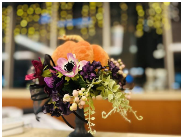
フロントカウンター 装飾