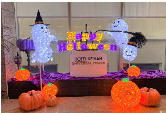
4階フォトスポット