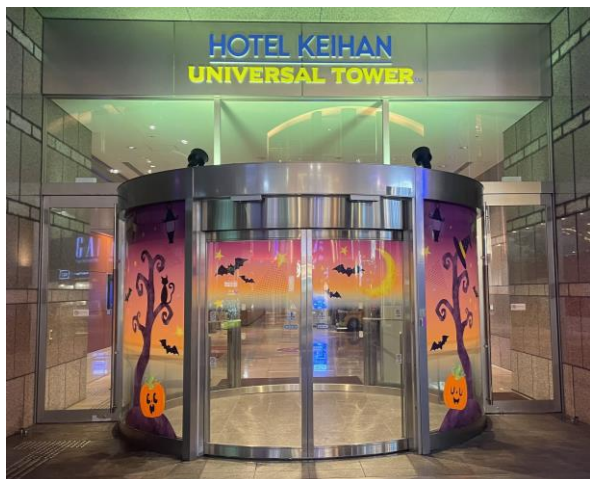
ユニバーサルシティ駅側エントランス

ユニバーサルシティ駅側のエントランスから、フロントまで続くハロウィーン装飾をお楽しみいただけます。お客さまの撮影スポットとして人気の大階段は、昼・夜で雰囲気が変わるので、ご宿泊の際にはぜひどちらも記念撮影を。