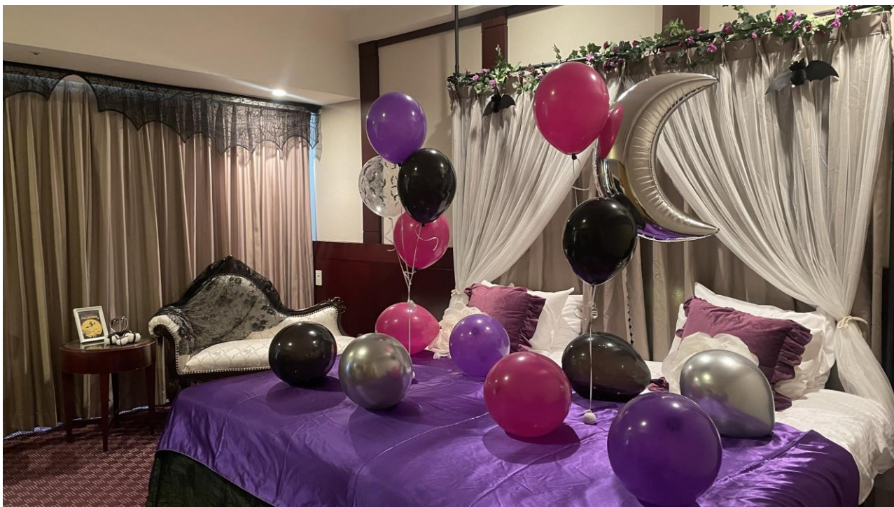
ハロウィーンルーム バルーンデコレーション付き