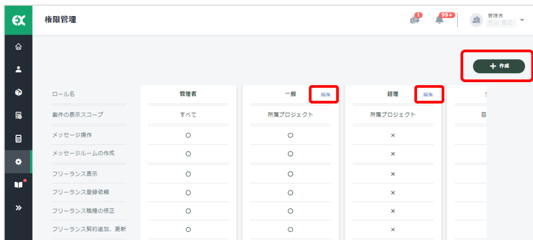
権限編集画面イメージ

これまで、全ての権限を持つ「管理者」、担当プロジェクトの管理を行う「一般」、支払い管理を行う「経理」と3つの権限を提供していましたが、一方で、『「管理者」の一部の権限を『一般』でもできるようにしたい』といったフレキシブルな設定はできませんでした。今回の機能リリースによって、「一般」「経理」が実行可能な機能・操作をカスタマイズできるだけでなく、新たな管理権限を自由に設定できるようになり、会社の現状の運用に合わせた柔軟な外部人材管理オペレーションを実現することができます。