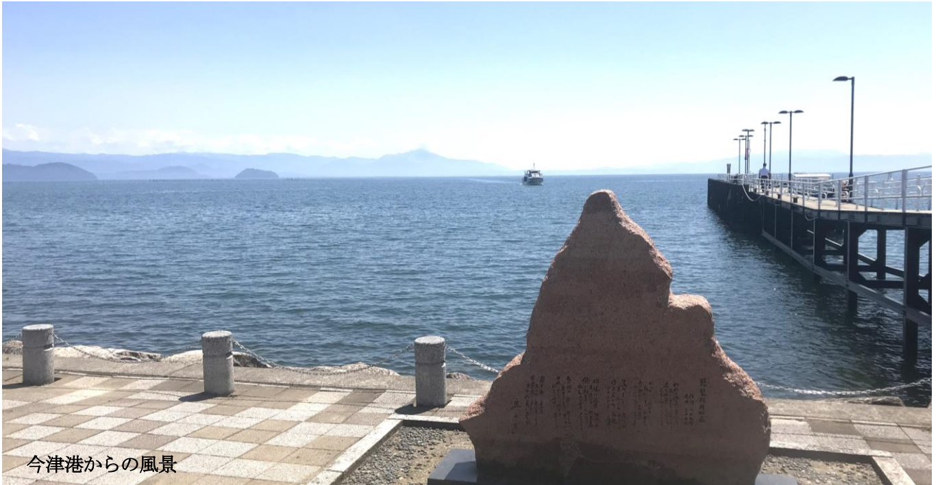
今津港からの風景

琵琶湖汽船株式会社（本社：滋賀県大津市浜大津、社長：川添 智史）では、今津港開港 50 周年を記念したオリジナルデザインの御船印を 2024 年 7 月 20 日 (土) より販売いたします。