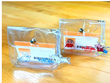
『オラと博士の夏休み』 PVC ポーチ(シロ/しんちゃん)