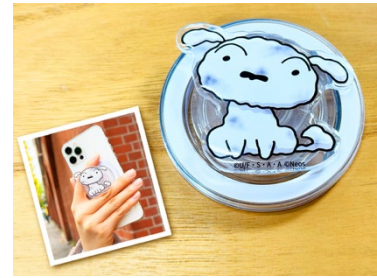
『炭の町のシロ』 MagSafe スマホグリップ