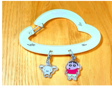
『オラと博士の夏休み』 アクリルカラビナ