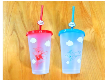
『オラと博士の夏休み』 タンブラー(しんちゃん/シロ)