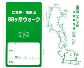
88ヶ所ウォーク ラリー帳

通常、イベント期間外はスタンプを設置していませんが、今回、御室仁和寺様のご協力により、チケット発売期間中、スタンプを常設します。