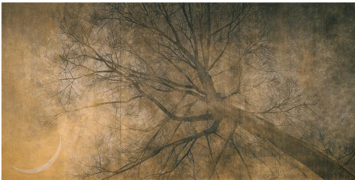
■「三日月」2005年 再興第90回院展