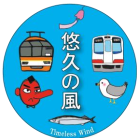
ヘッドマークデザイン