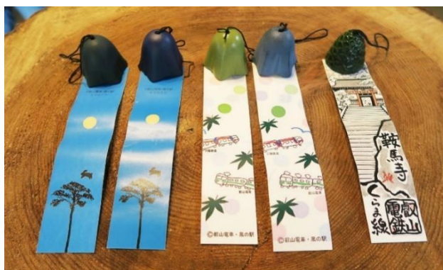
南部風鈴(イメージ)