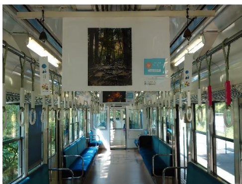
「悠久の風」号車内（展示イメージ）