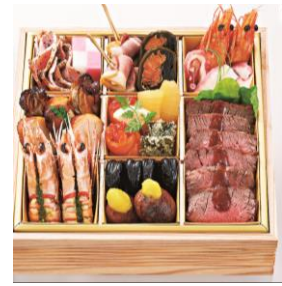
<アントニオズデリ> 洋風おせち 10,800円