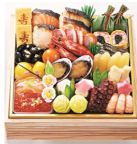
<京・料亭 わらびの里> 和風おせち 10,800円

<加賀料理 大志満><京都 ともえ><維新號> <ホテルオークラ><ローゼンハイム>