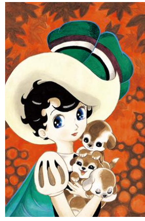
「サファイアと子犬」