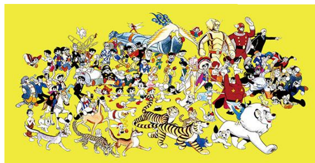
「キャラクター大行進」