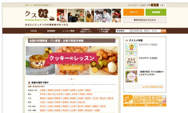
料理教室情報サイト「クスパ」

2024年12月より株式会社オレンジページが運営する「クスパ」は、全国約2,500教室の情報を掲載する国内最大規模の料理教室・パン教室・お菓子教室の紹介サイト。2004年に「Cooking School Park(クッキングスクールパーク)」としてオープンし、2023年には会員登録数10万人を突破しました。生徒と教室のマッチングのための情報だけでなく、教室オリジナルレシピなどのコンテンツ発信や、企業向けのプロモーションサービス等を提供しています。 https://cookingschool.jp