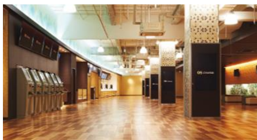
会場となるOSシネマズ神戸ハーバーランド