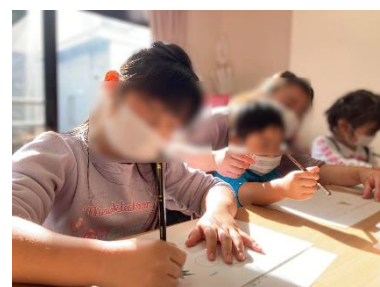
ワークショップのイメージ

本イベントは、調理食品製造メーカーとして「味の感動を伝える」をコーポレートメッセージに掲げ、1923年創業当時から食文化の担い手として神戸から皆様の食に貢献するエム・シーシー食品が、「食の豊かさにふれられる機会をひろげる」をミッションに掲げ「食」を切り口に教育機関での出張授業・研修や教育コンテンツ開発などに取り組んでいる omochi と、映画館を街のにぎわいや文化の情報発信基地として活用するプロジェクト「CINE LAB（シネラボ）」を展開するオーエスとのコラボレーションにより実施します。