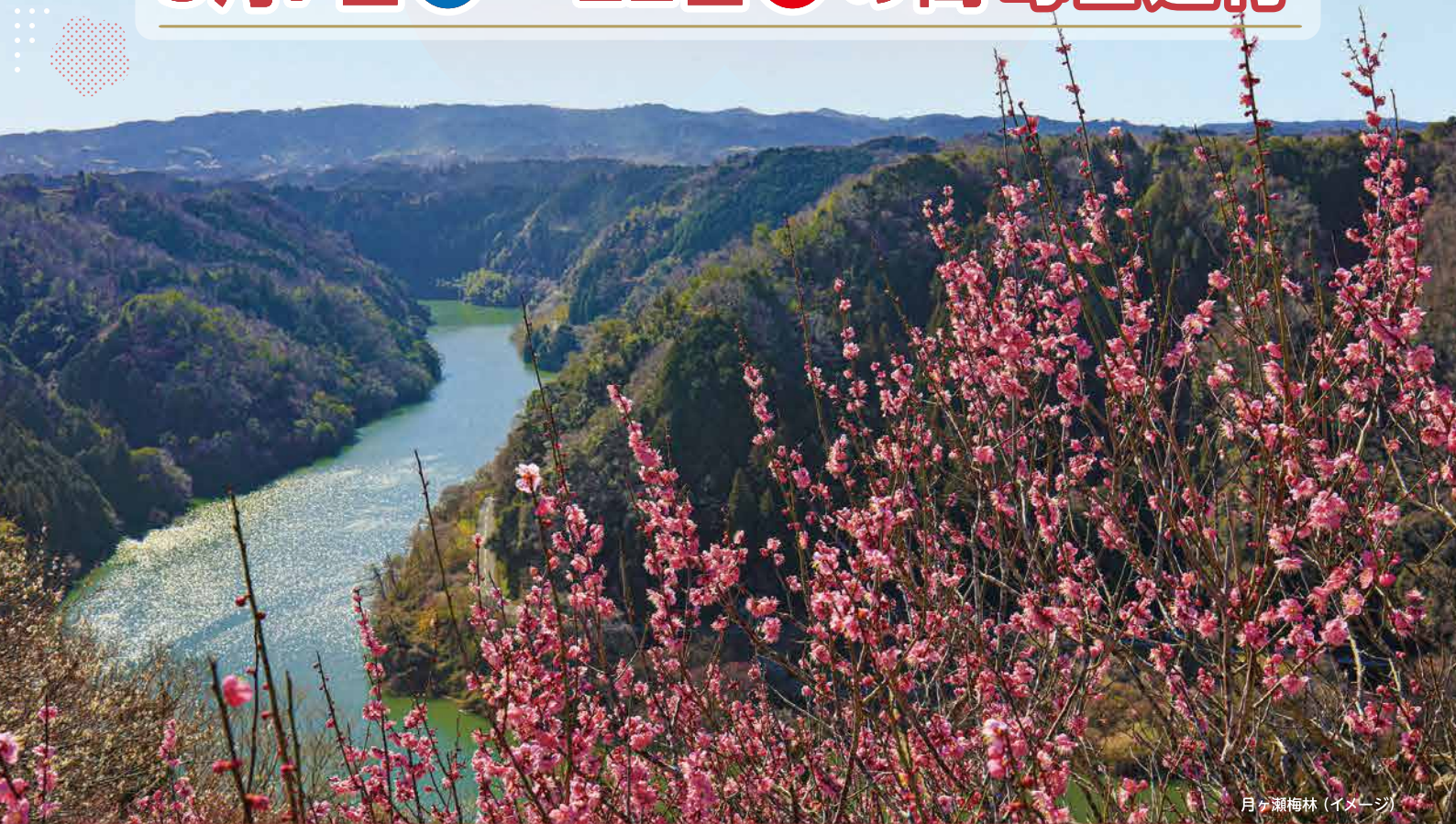
月ヶ瀬梅林 (イメージ)