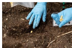
デントコーンの種まきや石拾い等