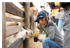
動物ふれあい 動物へのえさやり体験