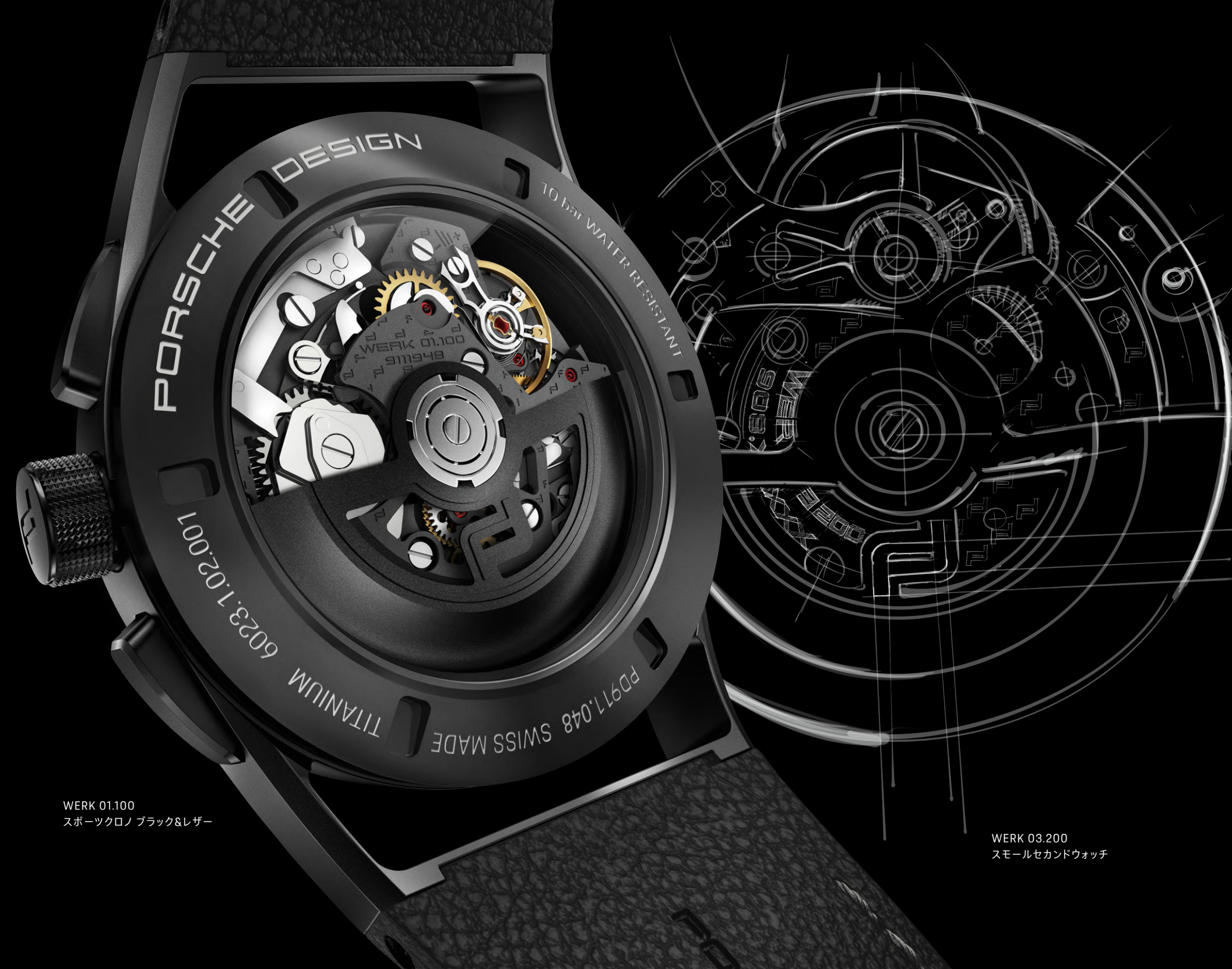
WERK 01.100 スポーツクロノ ブラック&レザー