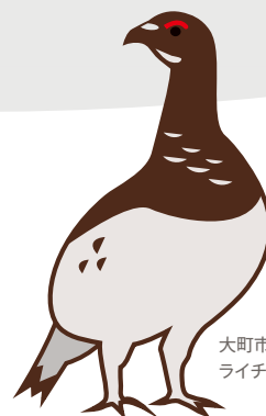
大町市の鳥 ライチョウ