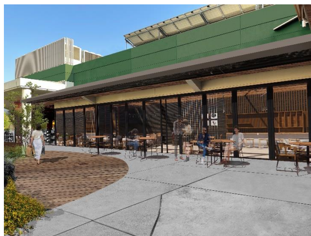
ダイニングストリートイメージ